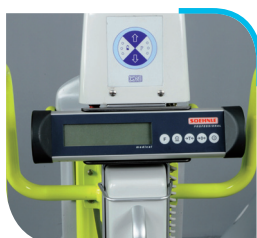
Pesée homologuée classe 3 médicale