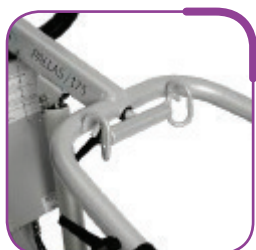
Crochets spéciaux pour transferts assis